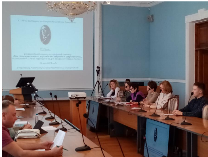
Рабочий момент семинара.

жизни и творчества превращается в символ минутных удовольствий, которые лишь оттеняют трагизм любви и всей жизни.