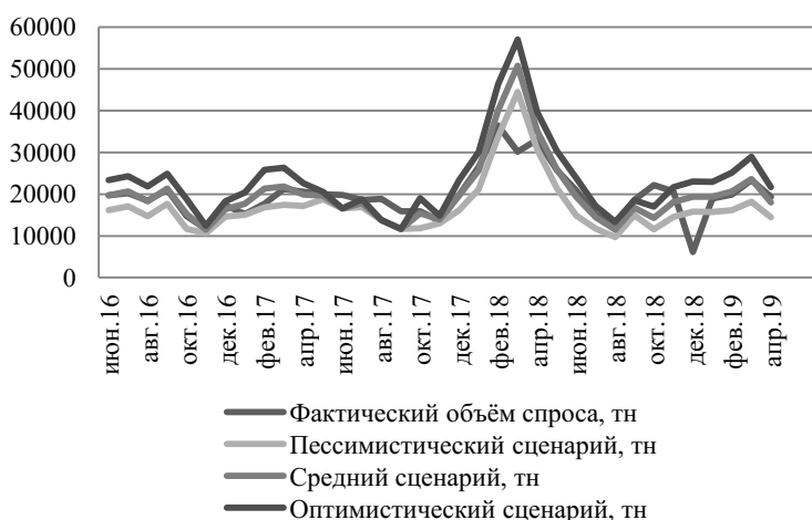
Рис. 3. Сравнение прогнозных и фактических данных поставок

Сравнение реальных и прогнозных значений по среднему, пессимистическому и оптимистическому сценариям спроса на рулон горячекатаный представлено на рис. 3.